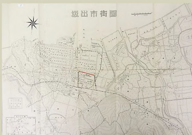
一級国道十一号線改良工事等の竣工に伴う仮引継ぎ箇所図 (坂出市街図) 昭和28年(1953)10月