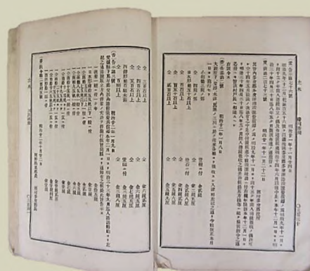
現行香川県令達類聚 二 多度津港入港銭 明治9年(1876)11月