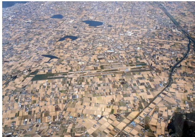
平成3年の林町周辺